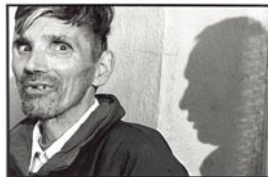
1. Asilo mental (Putendo)

Las imágenes de este documental fotográfico, junto a los textos testimoniales de Artaud y Van Gogh , nos instan a confrontarnos con un itinerario de desgracia, seguido por todos aquellos hombres que se aventuraron más allá de lo permitido, y fueron recluidos bajo el estigma de la locura y de la enfermedad.